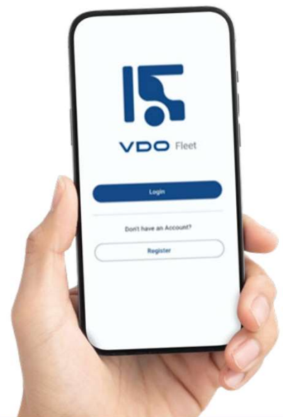
VDO Fleet App

Prêt pour l'optimisation de votre flotte ? Contactez-nous aujourd'hui pour en savoir davantage sur VDO Fleet.