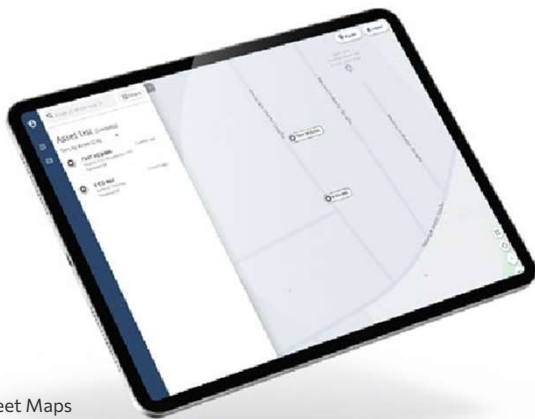
VDO Fleet Maps

VDO Fleet Maps facilite la planification et le suivi en temps réel de vos véhicules et de vos chauffeurs. Suivez la disponibilité de vos chauffeurs à tout moment, ainsi que l'emplacement exact et l'itinéraire de vos véhicules. Accédez aux détails précis de l'emplacement et vérifiez les temps de conduite rest